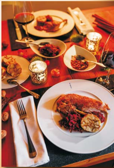
Hauptspeise ... klassisch: Geschmorte Ente