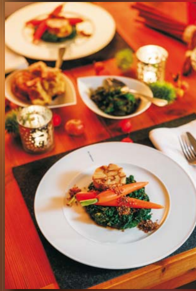
... vegetarisch: Geschmorter Grünkohl