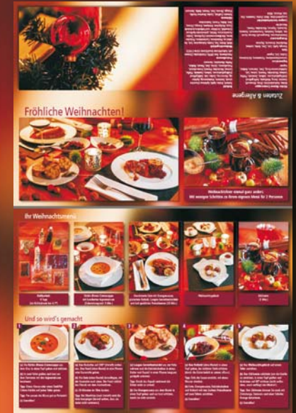
Beiliegende Anleitung (A4 quer, geklappt)