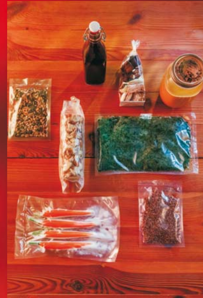
Vegetarisch: Suppe, Ingwernüsse, Grünkohl, Bundmöhren, Knödel, Crumble, Gebäck, Glühwein