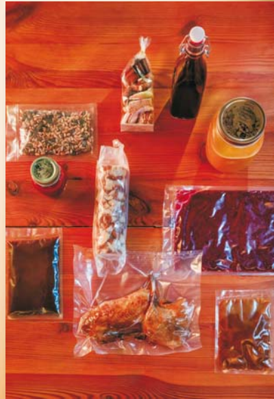
Klassisch: Suppe, Ingwernüsse, Ente, Sauce, Knödel, Rotkohl, Preiselbeeren, Gebäck, Glühwein